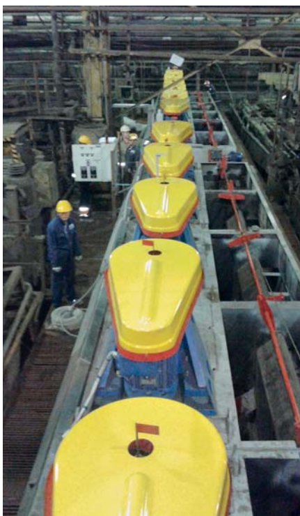
Монтаж флотомшины ФМР-6,3КМН на Норильской обогатительной фабрике

В 2015 г. АО «КМО» вывело на рынок новый стандарт флотационных машин – модель ФКМ-7,4КМ с кипящим слоем, которая является уникальной по объему и конструкции. Первая партия таких машин была отгружена для «ЕВРОХИМ – Усольский калийный комбинат». В настоящий момент в производстве находится вторая партия. В числе инновационных особенностей – рабочий объем камеры 7,4 м 3 , что повышает производительность флотомшины. В камерах применяются решетки специальной конструкции, разработанные проектировщиками предприятия, позволяющие устранять турбулентность в